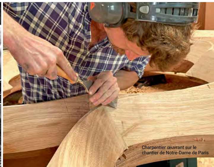
Charpentier œuvrant sur le chantier de Notre-Dame de Paris